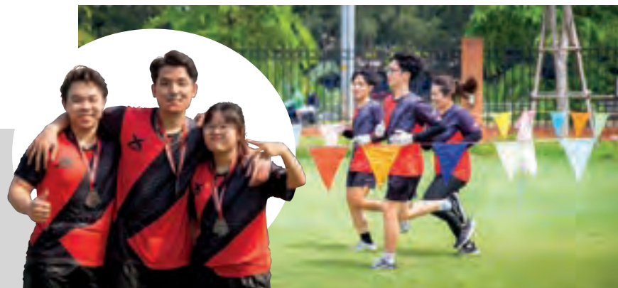
Giải chạy thể thao X-Run

Cùng tìm hiểu về cuộc sống sinh viên đầy sôi động tại RMIT qua những sự kiện nổi bật dưới đây.