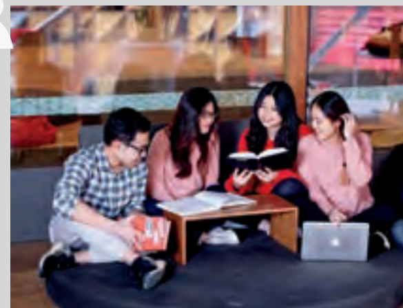
Chương trình trải nghiệm lãnh đạo toàn cầu