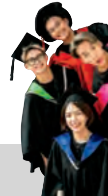
RMIT Việt Nam mừng khóa sinh viên tốt nghiệp lớn nhất từ trước đến nay