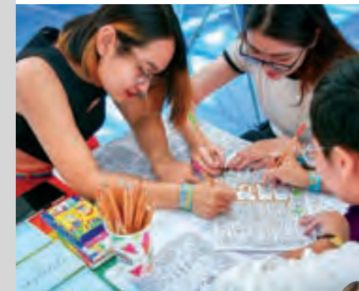
Ngày hội Wellbeing