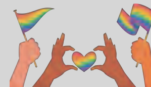
Tuần lễ Tự hào