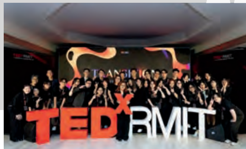
Sự kiện TEDxRMIT